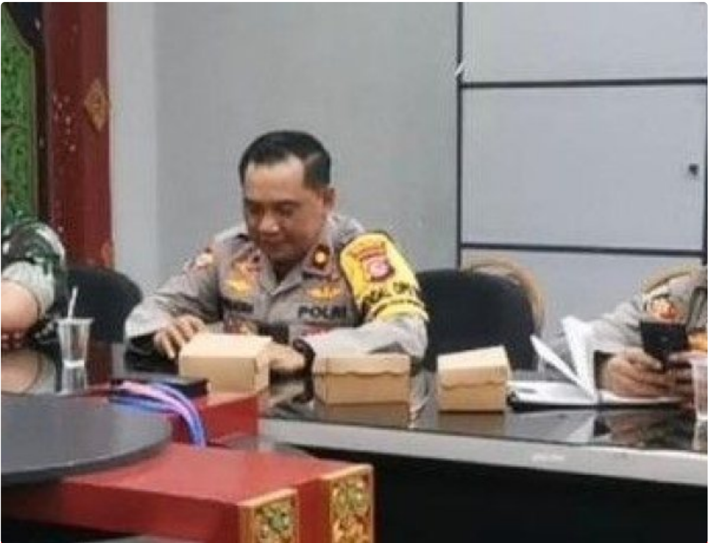
Kabagops Polresta Mataram saat menghadiri Rakor di Kantor Bupati Lombok Barat, Selasa (10/12/2024)

MATARAM, NTB – Dua tradisi budaya ikonik, Pujawali dan Perang Ketupat, akan kembali digelar di Pura Lingsar, Kecamatan Lingsar, Kabupaten Lombok Barat.